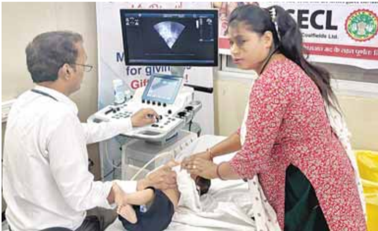
मरीजों में जन्मजात हृदय रोग से ग्रसित पाए गए। इन बच्चों के निःशुल्क उपचार की दिशा

शहडोल। साउथ ईस्टर्न कोलफील्ड्स लिमिटेड एवं श्री सत्य साईं संजीवनी अस्पताल के संयुक्त तत्वावधान तथा जिला प्रशासन के सहयोग से एस.ई.सी.एल. की धड़कन नामक बच्चों के हृदय जांच शिविर का आयोजन जिला चिकित्सालय में किया गया। शनिवार की सुबह 10 बजे से सायं 5 बजे तक शिविर का आयोजन किया गया। शिविर में 2 डी-ईको मशीन द्वारा लगभग 41 बच्चों की निःशुल्क हृदय जांच की गई, शिविर के प्रचार-प्रसार में रोटरी क्लब विराट शहडोल के सभी रोटैरियन सदस्य सक्रिय रूप से सम्मिलित रहे। रोटैरियन सदस्यों ने जिला चिकित्सालय पहुंचकर बाल-अतिथि सेवा में भी सहयोग प्रदान किया। द्वितीय स्क्रीनिंग कार्यक्रम में कुल 41 मरीजों की जांच की गई, जिनमें से 20